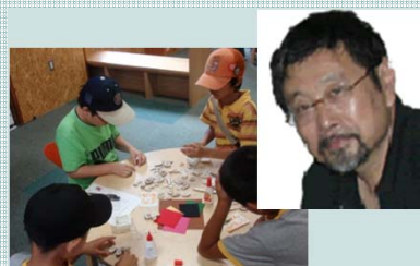
エゾシカを知り、有効活用する エゾシカ角クラフト教室

増え続けるエゾシカの個体数調整策の一つとして有効活用（食べる、使う、着る）に関する活動を10年間行ってきました。これからは、エゾシカを含む自然資源を利用した観光と食をテーマにしたいと思っています。