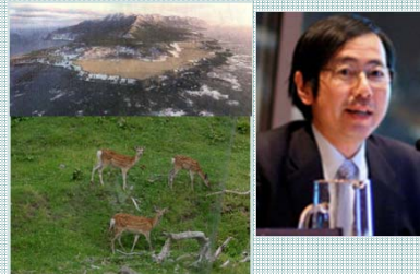
知床海域管理計画/ エゾシカ順応的管理

数理生態学を用いて、愛知万博環境影響評価、北海道エゾシカ管理、知床・屋久島世界遺産などの委員を務めながら、生態系管理の具体的な解を提示するために研究を進めています。（社）水産資源・海域環境保全研究会代表理事。