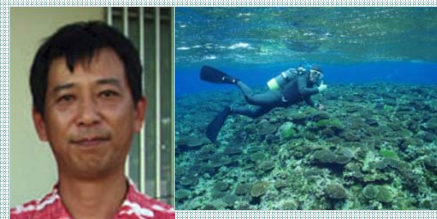
恩納村漁協 「サンゴ礁の海を育む」活動

沖縄県恩納村漁協で、モズク、海ぶどうなどの養殖技術開発と産業化に携わってきました。また、サンゴ再生やオニヒトデ除去、赤土流出防止など海域の環境・生態系保全活動にも取り組んでいます。