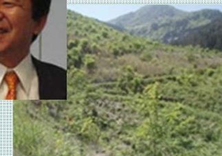
徳島県立高丸山千年の森 植栽地の様子