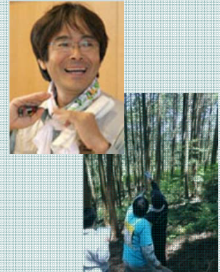
矢作川森の健康診断

大学在学中から有機農業運動に没頭し、農業就業を経て、1980年農林水産省入省。そのかたわら「日本の食糧・農業・健康を考える愛知の会」幹事など食と農の市民運動を経て、「足助きこり塾」「矢森協」「伊勢・三河湾流域ネットワーク」創設にかかわる。現在、矢作川森の健康診断実行委員会代表、矢作川水系森林ボランティア協議会代表。NPO夕立山森林塾で「木の駅プロジェクト」、NPO山里文化研究会で山里の聞き書き活動を進めています。