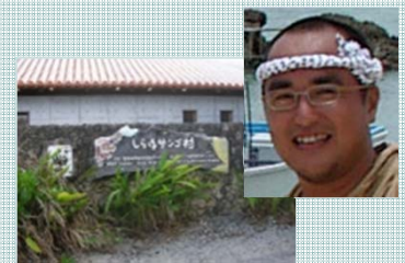
しらほサンゴ村 (WWFサンゴ礁保護研究センター)

沖縄県石垣島白保集落において、サンゴ礁保全に資する持続可能な地域づくりに取り組んでいます。また、全国・世界の魚垣を有する地域の連携・交流を図る世界海垣サミットの開催を目指した取り組みを行っています。