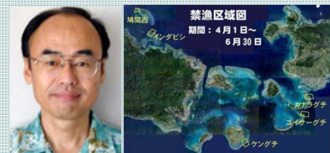
八重山海域 MPAによる資源管理

熱帯・亜熱帯における水産資源管理とサンゴ礁生態系保全を扱っています。最近、MPA（海洋保護区）や里海に関心をもっています。現在は、沖縄県の石垣島で水産の普及指導員をやっています。また、日本サンゴ礁学会・サンゴ礁保全委員会の委員長もやっています。