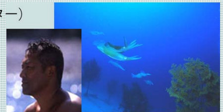
海の中の森づくり アオリイカの人工産卵床として 間伐材を海底に設置

人と海とが共存できる「里海」のモデルを高知県柏島でつくるため、多くの人に海を知ってもらい、共に育てていくための活動を行っています。定期的な海洋環境調査、自然を実感する体験学習やエコツアー、間伐されたヒノキ枝を使ったアオリイカの産卵床づくりなど、精力的に取り組んでいます。