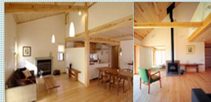
地域材を用いた環境共生型の 住宅づくり

福島県に本社を置き、東京から宮城に拠点を持つ工務店です。全棟、国産材100%、ソーラーハウスの認定を取得したエアパス工法で、大工が一棟一棟手刻みし、漆喰仕上げの家づくりを行っています。