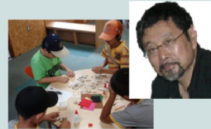
エゾシカを知り、有効活用する エゾシカ角クラフト教室

増え続けるエゾシカの個体数調整策の一つとして有効活用(食べる、使う、着る)に関する活動を10年間行ってきました。これからは、エゾシカを含む自然資源を利用した観光と食をテーマにしたいと思っています。