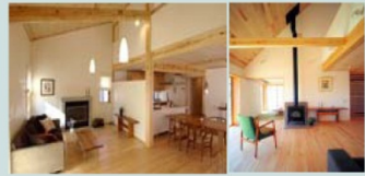
地域材を用いた環境共生型の住宅づくり

福島県に本社を置き、東京から宮城に拠点を持つ工務店です。全棟、国産材100%、ソーラーハウスの認定を取得したエアパス工法で、大工が一棟一棟手刻みし、漆喰仕上げの家づくりを行っています。