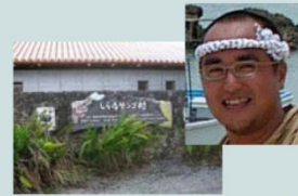
しらほサンゴ村 (WWFサンゴ礁保護研究センター)

沖縄県石垣島白保集落において、サンゴ礁保全に資する持続可能な地域づくりに取り組んでいます。また、全国・世界の魚垣を有する地域の連携・交流を図る世界海垣サミットの開催を目指した取り組みを行っています。