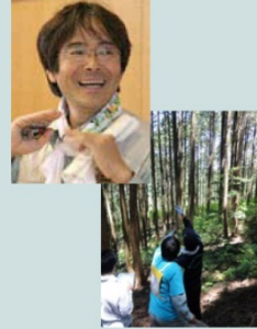
矢作川森の健康診断

大学在学中から有機農業運動に没頭し、農業就業を経て、1980年農林水産省入省。そのかたわら「日本の食糧・農業・健康を考える愛知の会」幹事など食と農の市民運動を経て、「足助きこり塾」「矢森協」「伊勢・三河湾流域ネットワーク」創設にかかわる。現在、矢作川森の健康診断実行委員会代表、矢作川水系森林ボランティア協議会代表。NPO立山森林塾で「木の駅プロジェクト」、NPO山里文化研究会で山里の聞き書き活動を進めています。