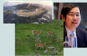
知床海域管理計画/ エゾシカ順応的管理

数理生態学を用いて、愛知万博環境影響評価、北海道エゾシカ管理、知床・屋久島世界遺産などの委員を務めながら、生態系管理の具体的な解を提示するために研究を進めています。(社)水産資源・海域環境保全研究会代表理事。