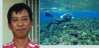
恩納村漁協 「サンゴ礁の海を育む」活動

沖縄県恩納村漁協で、モズク、海ぶどうなどの養殖技術開発と産業化に携わってきました。また、サンゴ再生やオニヒトデ除去、赤土流出防止など海域の環境・生態系保全活動にも取り組んでいます。