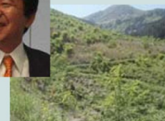
徳島県立高丸山千年の森 植栽地の様子