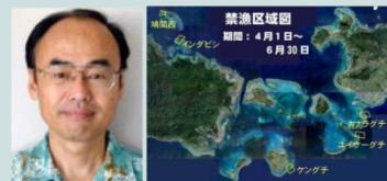
八重山海域 MPAによる資源管理

熱帯・亜熱帯における水産資源管理とサンゴ礁生態系保全を扱っています。最近、MPA(海洋保護区)や里海に関心をもっています。現在は、沖縄県の石垣島で水産の普及指導員をやっています。また、日本サンゴ礁学会・サンゴ礁保全委員会の委員長もやっています。